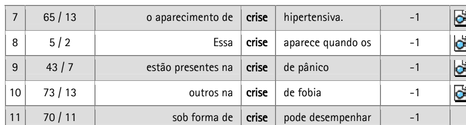
TABELA 5. Concordância KWIC (3 palavras) da expressão de pesquisa: crise N° de concordâncias obtidas: 11 distribuídas por 2 ficheiros. Frequência da totalidade das instâncias da concordância: 0.02 %.

Finalmente, a TABELA 6 apresenta os resultados obtidos ao ser pesquisado o termo «transtorno», revelando não apenas que este deveria ser o colocado escolhido, mas também que havia muitas outras expressões recorrentes contendo a palavras «transtorno». Entre elas, destacam-se «transtorno de ansiedade», «transtorno obsessivo-compulsivo» (TOC) e Transtorno Dismórfico.